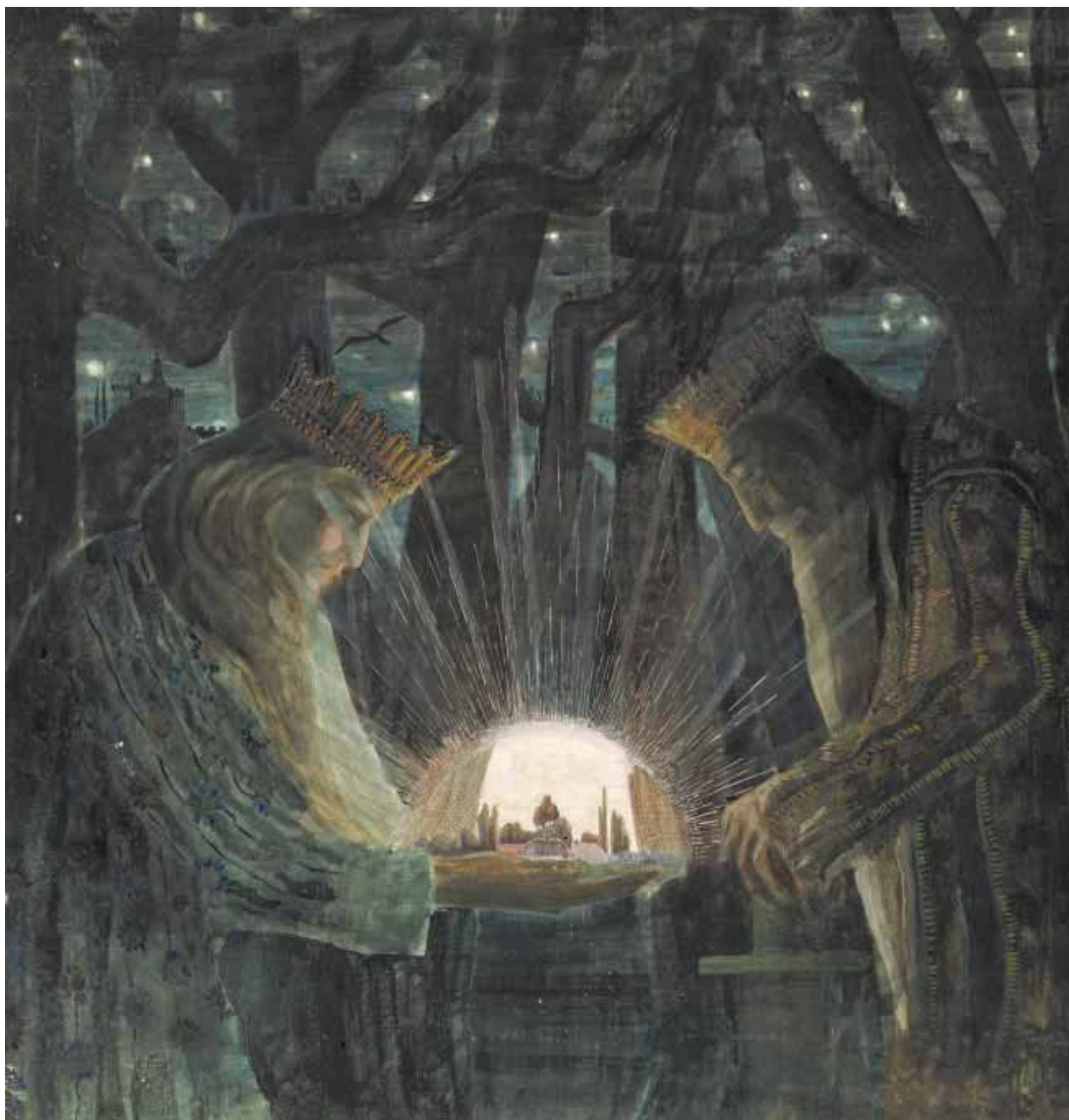
“The Tale of Kings” by M. K. Čiurlionis, 1908