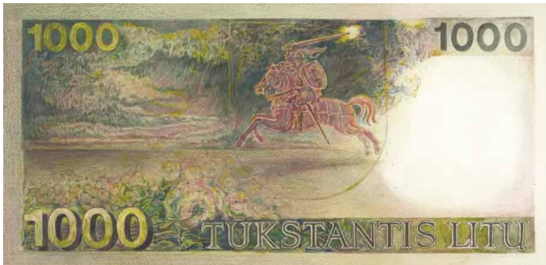
Sketch for the banknote. Design by R. Valantinas