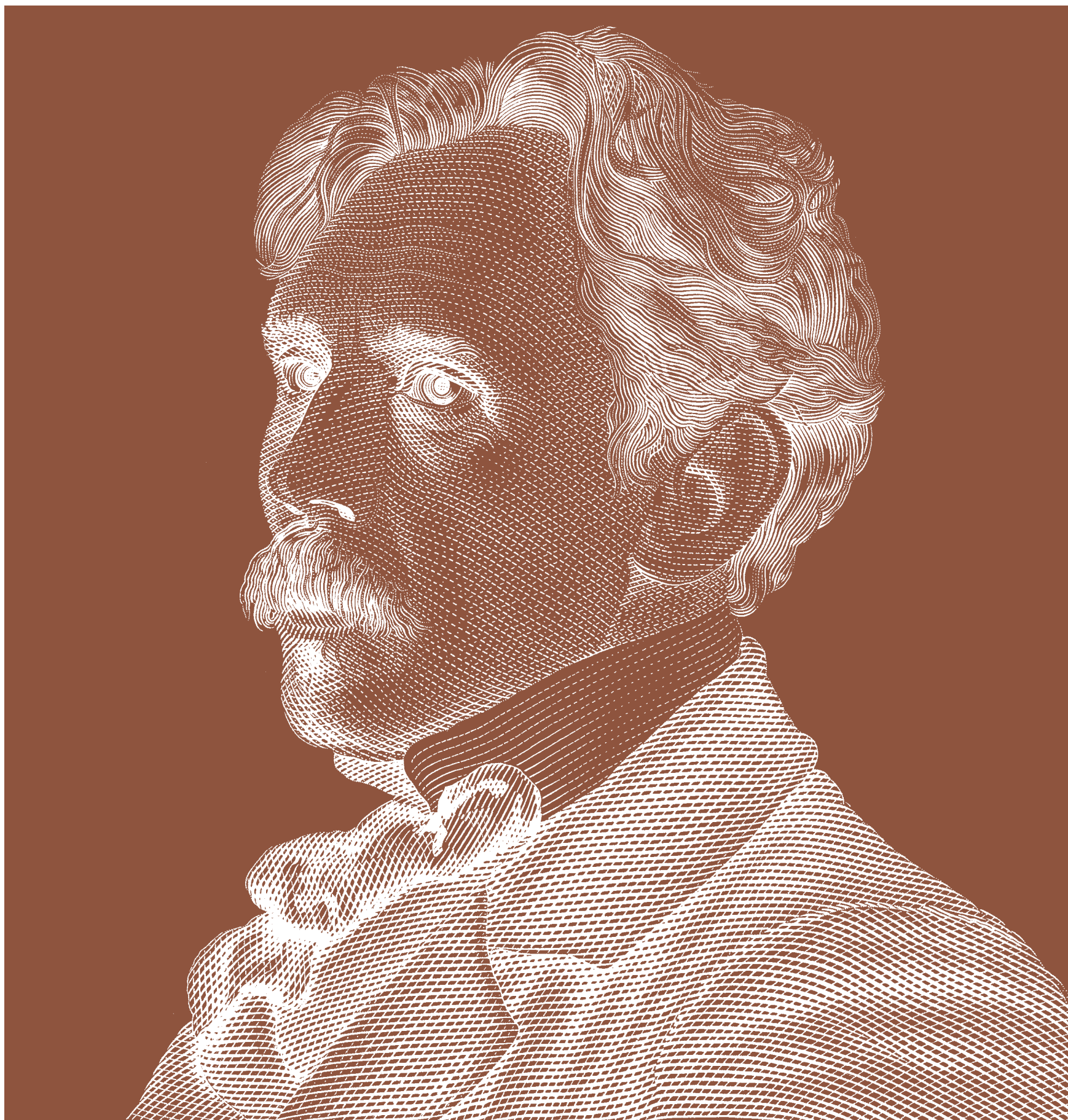
Negative of the engraving of M. K. Čiurlionis' portrait