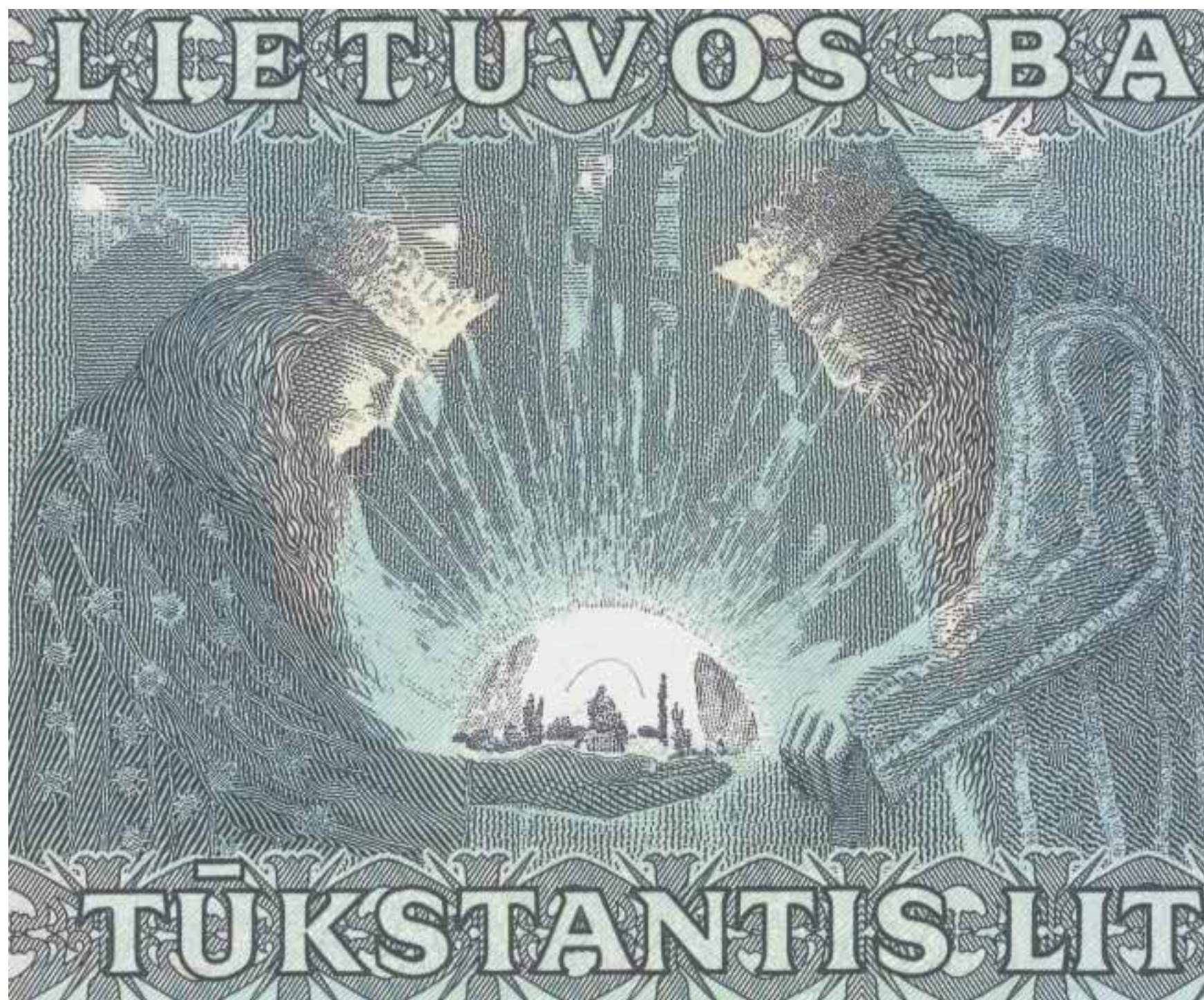
Detail of the banknote